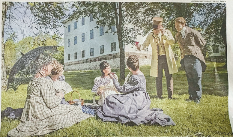
Louhisaaren kartanolinna puisto tarjosi jo empire-ajan ihanteellisen paikan vaikka piknikille.