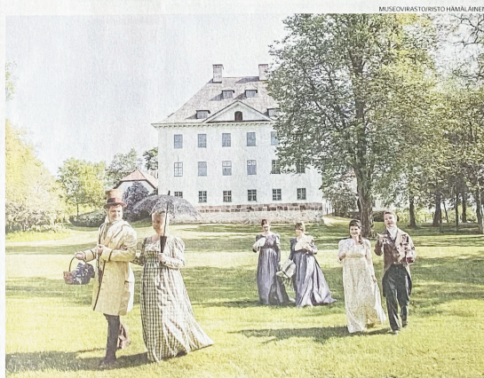
Hameiden pituudesta huolimatta empire-ajan naisten pukumuoti oli kevyen ilmavaa ja puvut yksinkertaisen tyylikkäitä.