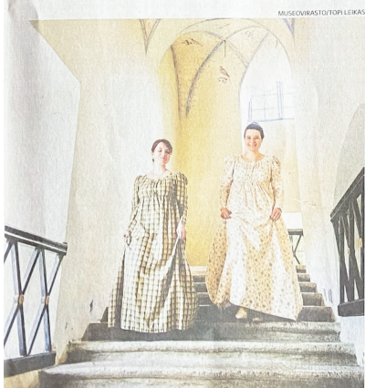
Naisten empire-asujen linjat olivat suoria ja vyötärö nostettiin rintojen alle.