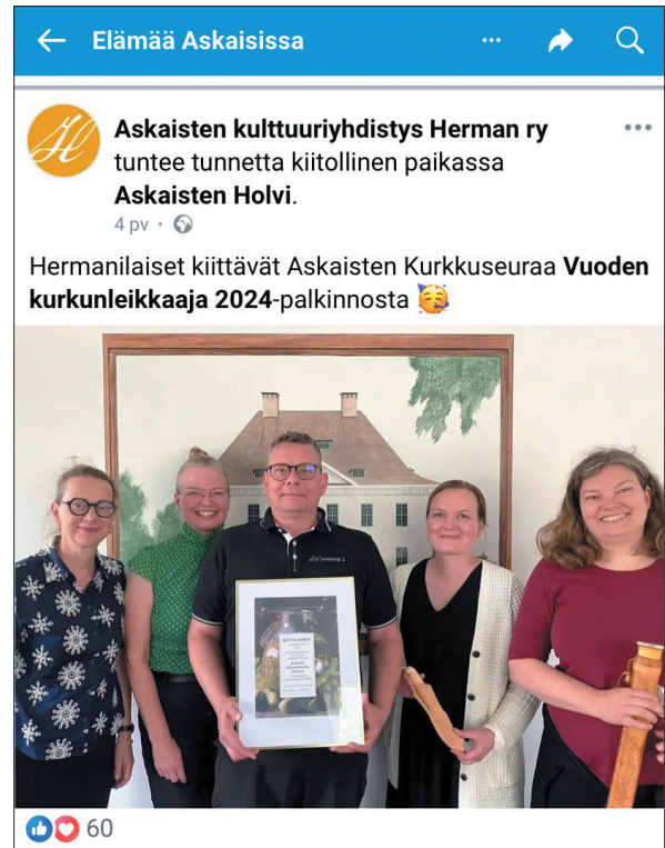
Vuoden Kurkunleikkaaja -palkintoa juhlistettiin Askaisten Holvilla 15.8.