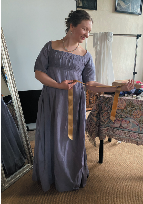
Anni Shepherdin Historiallinen pukeutumisnäytös oli taidokas ja vauhdikas.