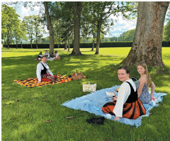
Kansallispukuja ja piknik-idylliä Louhisaaren kartanolinnan puistossa 4.8.