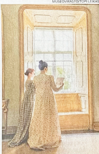
Naisten asuissa helman leveys koettiin taakoa, jotta linja säilyi pyväismäisen suorana.