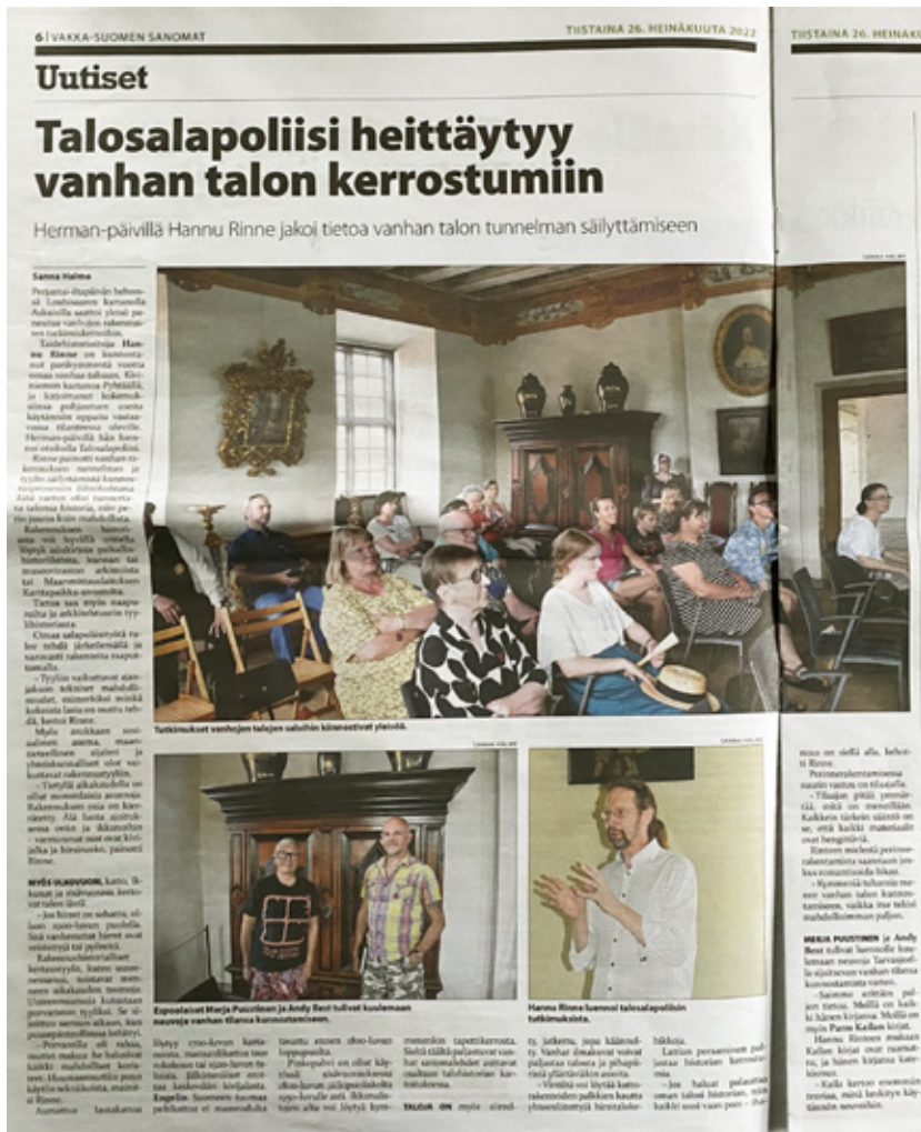
Vakka-Suomen Sanomat 26.7.2022.