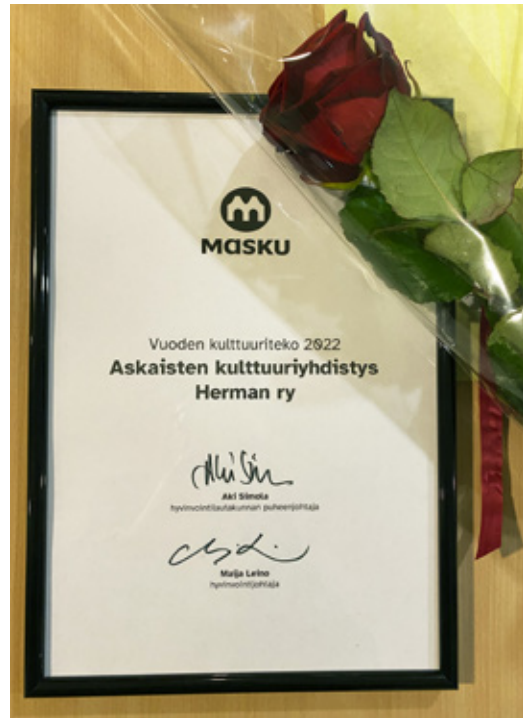
Vuoden kulttuuriteko 2022 -palkinto.